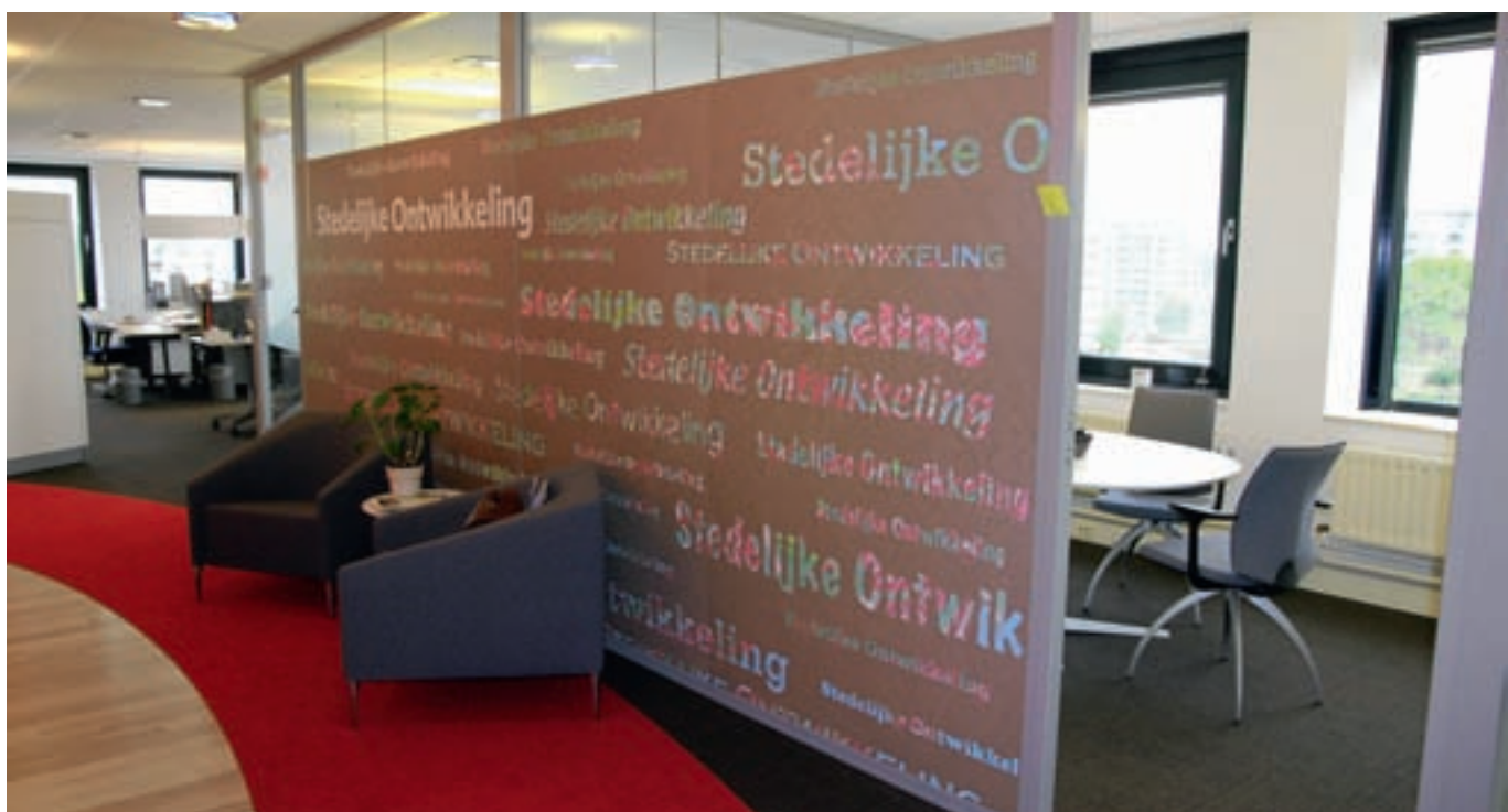
Een scheidingwand langs de loopcirkel met links op de achtergrond een werkhoeek. Direct achter de wand een dichte werkruimte die de andere werkplekken scheidt.

Opdrachtgever: Gemeente Capelle aan den IJssel Binnenhuisarchitect: Kubik, Utrecht Glas en wanden: Planeffect Stroomwanden, Geldermalsen Plafonds: Rockfon, Roermond Geluidabsorberende wanden en concentratiecabines: Sontech Lawaaibestrijding, Dordrecht Afbouw: Verwol Projecten, Delft Akoestisch advies: Sontech Lawaaibestrijding, Dordrecht