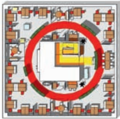
De cirkelvormige oplossing voor een vierkant kantoor. (Tekening: Kubik, Utrecht)

Los daarvan is de hele atmosfeer op beide afdelingen er op vooruitgegaan. Werken in een mooie, stille en goed ingerichte ruimte is nu eenmaal een stuk prettiger. Matarazzi: "Het grappige is dat afdelingen ook ideeën van elkaar hebben overgenomen. Zo heeft Stedelijke Ontwikkeling een kaartentafel waar twee computerschermen aan zijn bevestigd. Bij de tekeningen kunnen ze direct de bijbehorende documentatie oproepen. Onder de tafel is ruimte gemaakt voor archief. Dat vonden ze bij Welzijn & Onderwijs ook wel handig, dus hebben zij ook voor zo'n werktafel gekozen." De herinrichting is helemaal op die manier tot stand gekomen. Hoewel de herinrichting van beide kantoorlagen nu een feit is, loopt het pilotproject in het gemeentehuis van Ca-